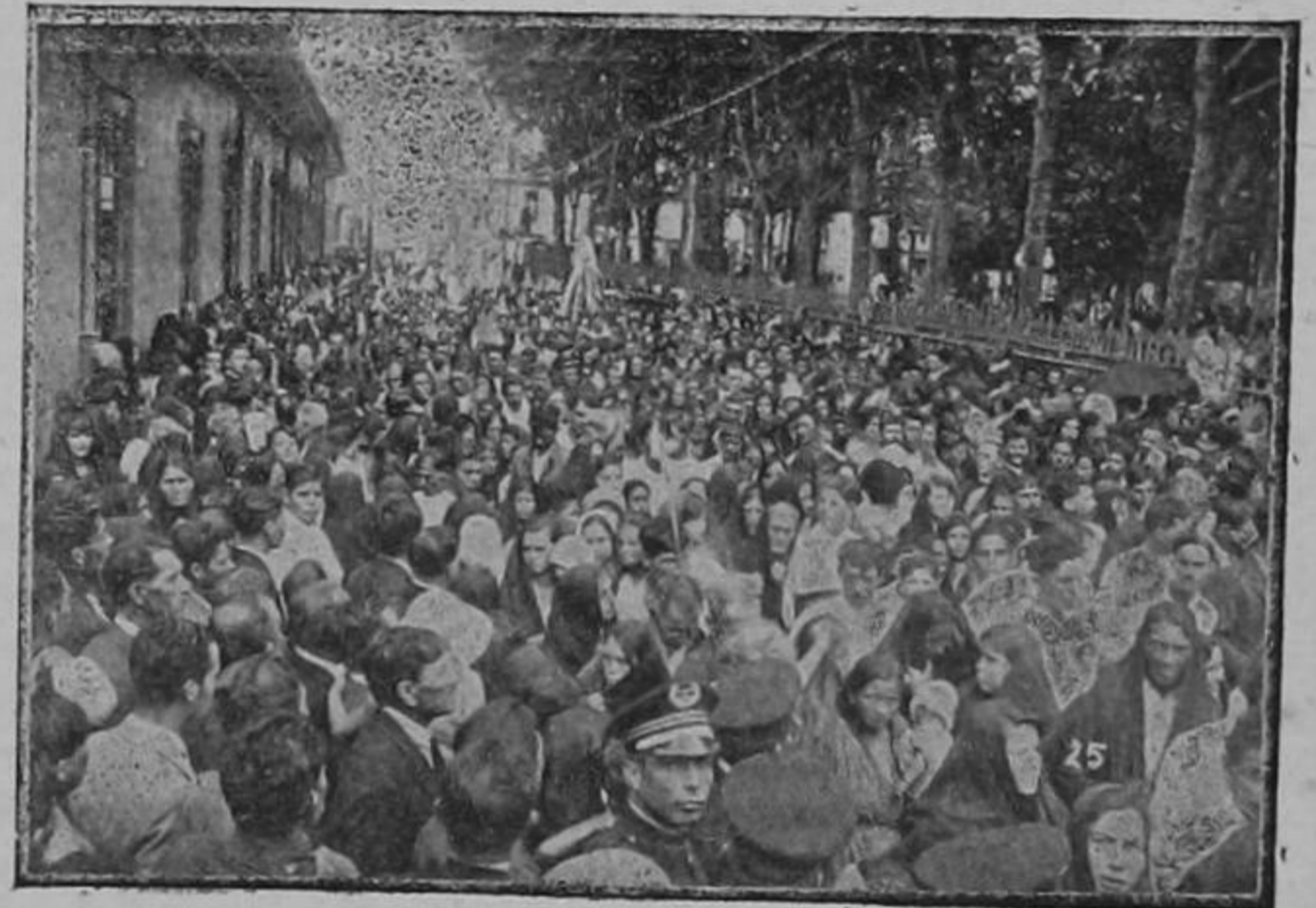
Otro aspecto de la gran procesión

El rico que con sus limosnas da de comer al hambriento y viste al desnudo, sepa que no pierde lo que da; pues no hace otra cosa que traspasarlo a otras manos, que se lo guardarán para presentárselo en la hora del Juicio Supremo, a fin de que con ese precio compre el perdón de sus pecados y la vida eterna.—Fray Luis de Granada