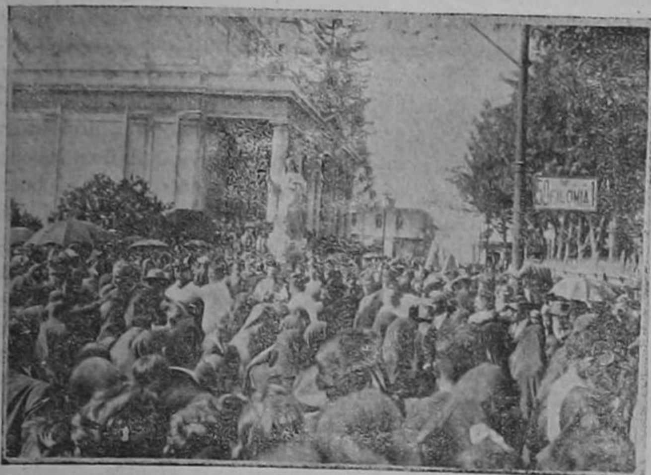
La procesión al salir de la Metropolitana